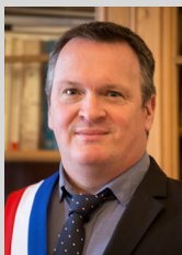
Chères Réolaises, chers Réolais,

Le premier Tempo de l'année me donne l'occasion de vous formuler mes vœux les plus sincères en ce début d'année 2022, à vous toutes et tous et à celles et ceux qui vous sont chers.