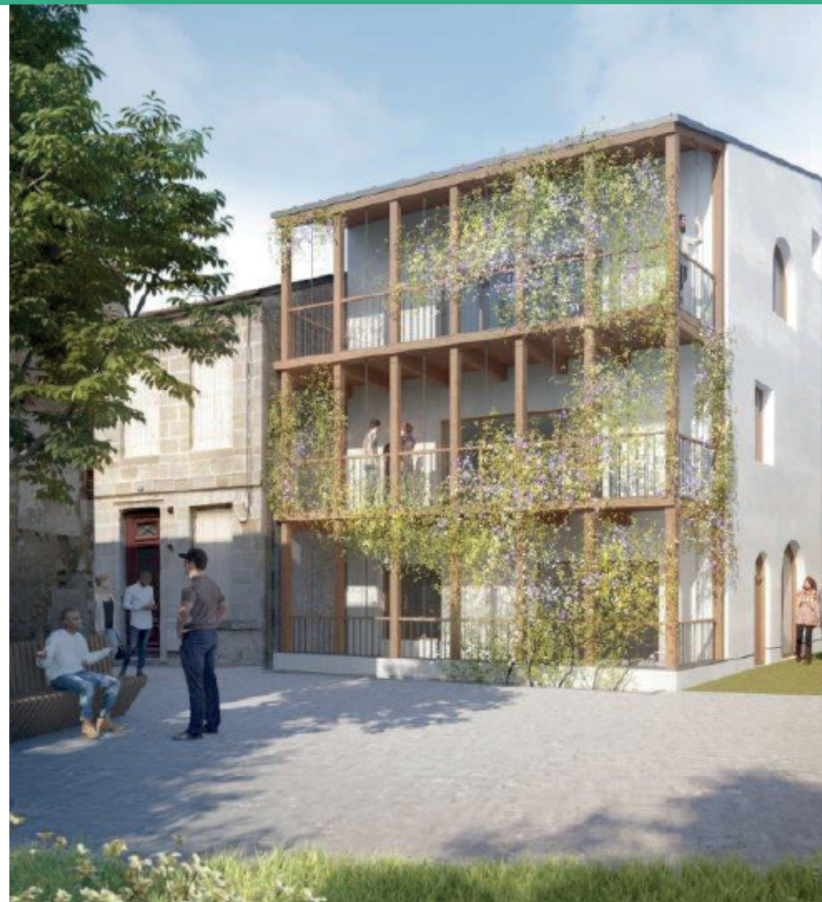
Résidence « Jardin sur le Toit »