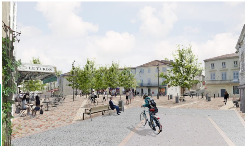
Place de la Libération