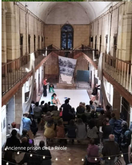
Ancienne prison de La Réole