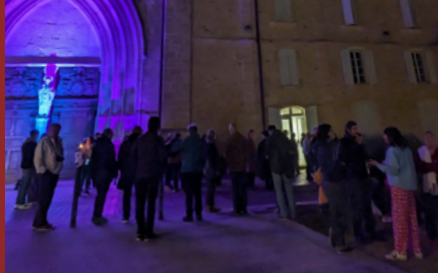
Visite nocturne à La Réole