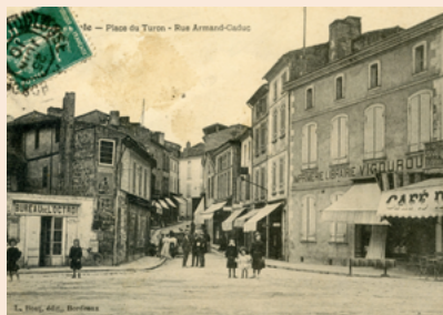
La Place de la Libération autrefois