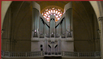
Orgue de l'église Saint-Pierre