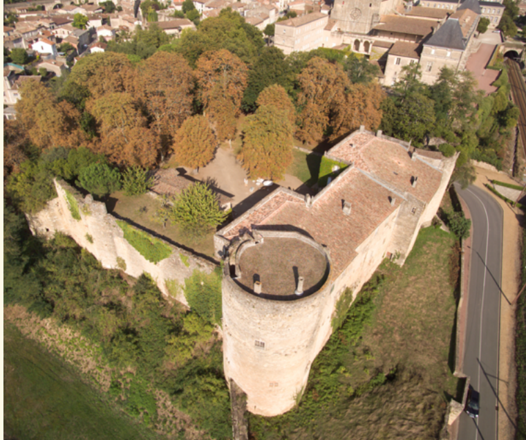
Vue aérienne du château des Quat'Sos