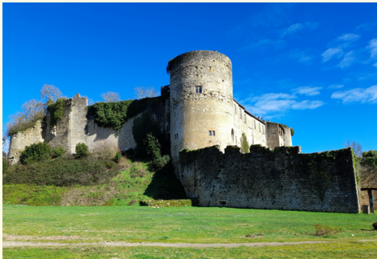
Le château des Quat'Sos

Réservation obligatoire : 06 19 76 16 33 Sous réserve de compatibilité avec les travaux : voir les informations actualisées sur notre page Facebook ou l'application Intramuros.