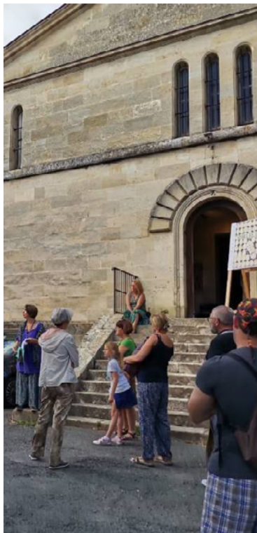
Visite guidée à l'ancienne prison