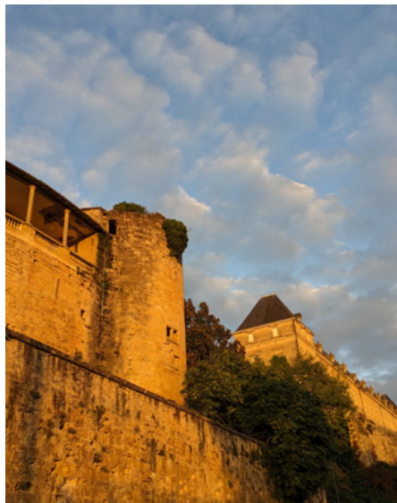
Le château des Quat'Sos