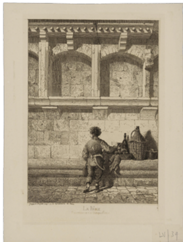
Maison médiévale à La Réole, Léo Drouyn