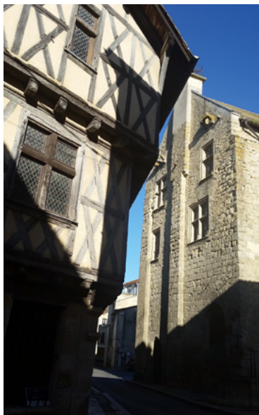
Maison à colombage et ancien Hôtel de ville

Sous réserve de compatibilité avec les travaux : voir les informations actualisées sur notre page Facebook ou l'application Intramuros.