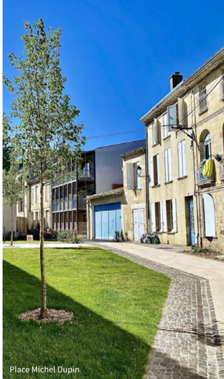
Place Michel Dupin